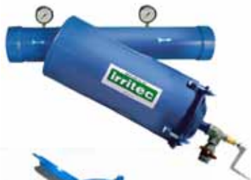
Kontrollfilter 120 Mesh

*Produktgewährleistung nur mit Irritec Filter-Quarzsand