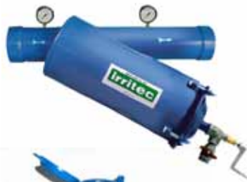
Kontrollfilter 120 Mesh

*Produktgewährleistung nur mit Irritec Filter-Quarzsand