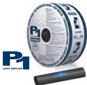
Drucksensitiver P1® Gemüse-Tropfschlauch

Die Produktdetails entnehmen Sie bitte den technischen Produktunterlagen.